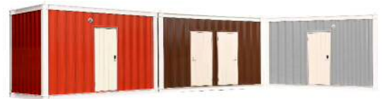
※災害時宿泊ユニット:クレイドルキャビンイメージ

脚を伸ばし、くつろぐことのできる寝室タイプや、衛生的な生活のためのトイレ・シャワー付きタイプなど、快適な生活を提供することが可能です。また、災害時の避難所・車中泊において発生するプライバシーの問題やエコノミークラス症候群による問題を解決いたします。